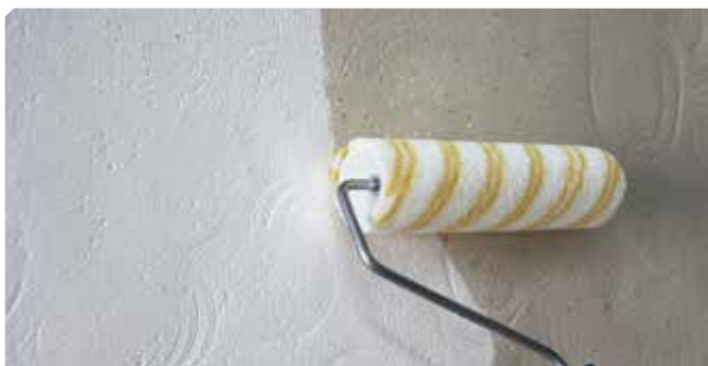
■ Imprimación del soporte con FIJAPREN AL DISOLVENTE