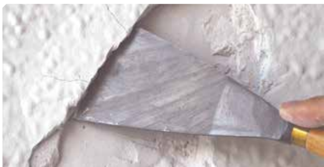
■ Fondo viejo mal adherido