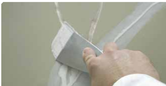
■ Fisuras superiores a 2 mm tratadas con masilla elástica