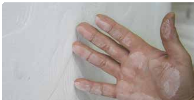
■ Soporte pulverulento.