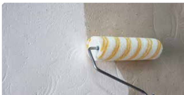
■ Imprimación del soporte con FIJAPREN AL DISOLVENTE