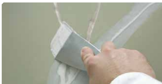
■ Fisuras superiores a 2 mm tratadas con masilla elástica