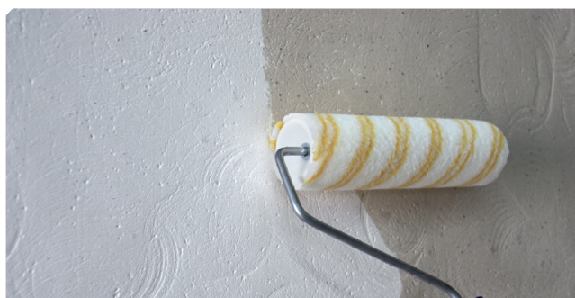
■ Imprimación del soporte con FIJAPREN AL DISOLVENTE