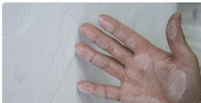
■ Soporte pulverulento.