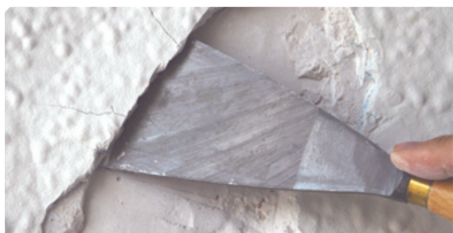
■ Fondo viejo mal adherido