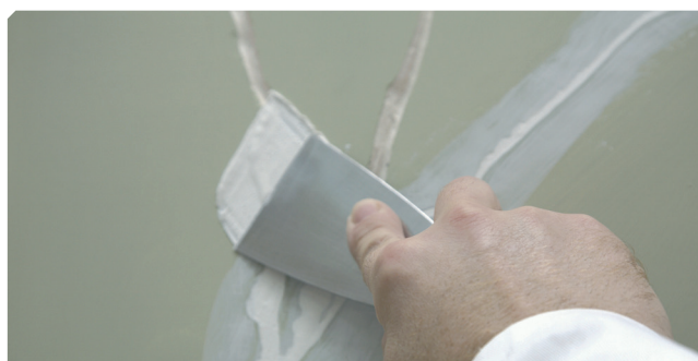
■ Fisuras superiores a 2 mm tratadas con masilla elástica