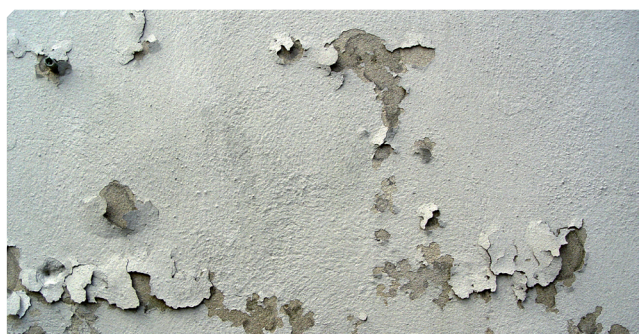
■ Fondo viejo mal adherido