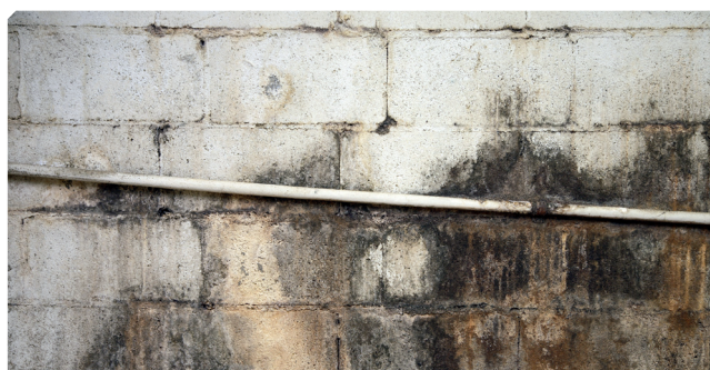
■ Humedades y microorganismos sobre soporte