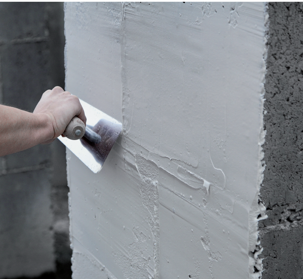
Enluciendo de lleno con llana sobre fondo de cemento