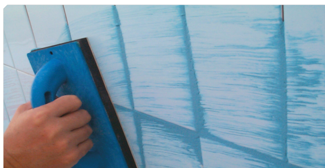
■ Aplicación del producto