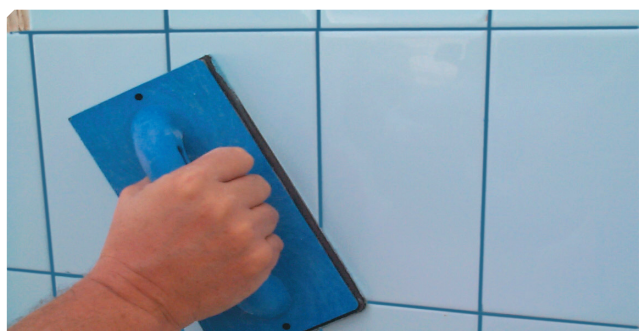
■ Limpieza del sobrante con la llana