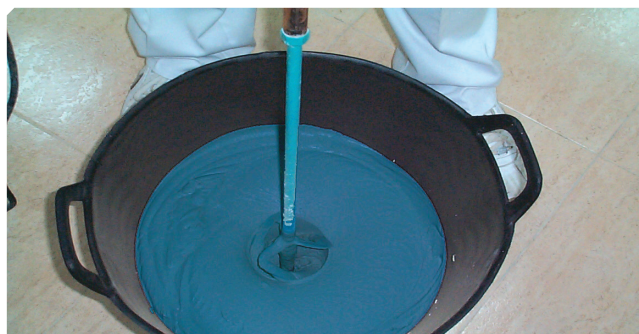
■ Amasado del producto