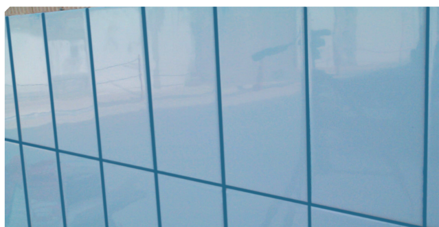
■ Aspecto tras limpieza total con agua