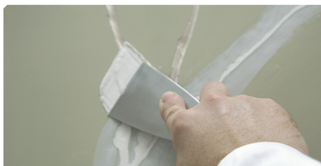
■ Fisuras superiores a 2 mm tratadas con masilla elástica