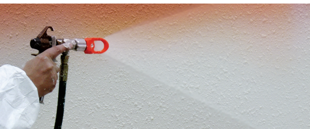
Aplicación en airless sobre fondo de gotelé plastificado.