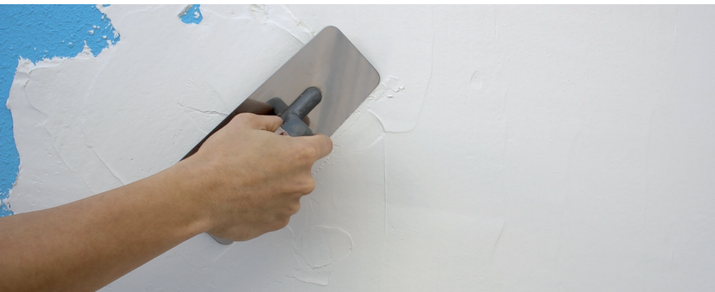
Enluciendo de lleno con llana de tamaño medio sobre fondo de gotelé plastificado (pintura plástica tradicional)