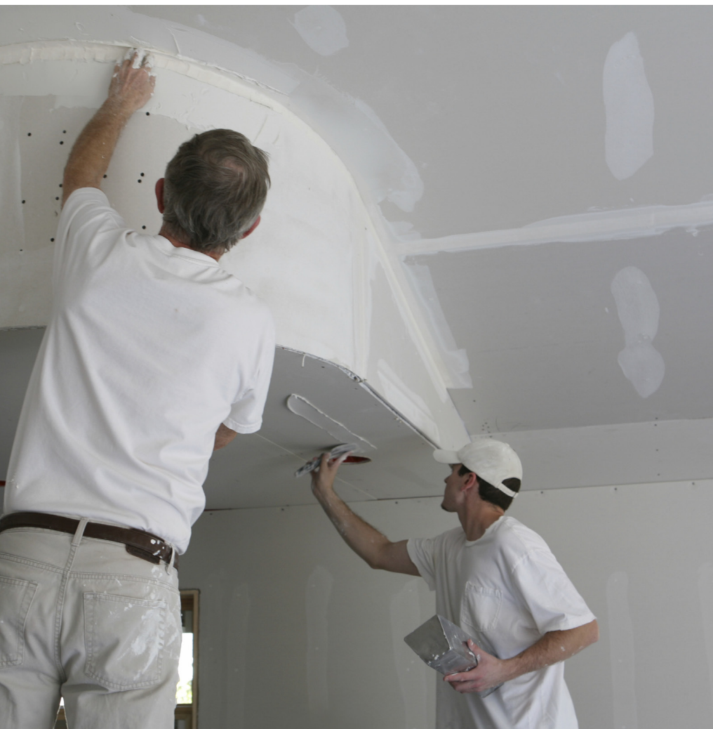
Aplicación con espátula ancha (20 – 22 cm) sobre juntas de placas de cartón-yeso.