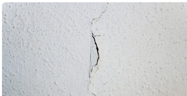
■ Oquedades sobre soporte fatigado