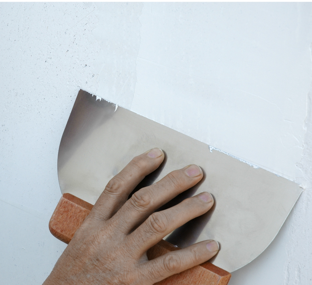
Enlucido de lleno con espátula ancha (20 – 22 cm) sobre fondo de yeso o pintura tradicional